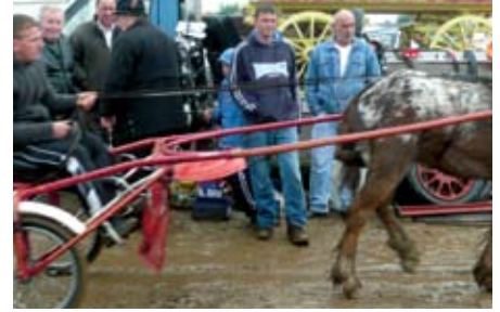
Canolfannau'n bwrw iddi