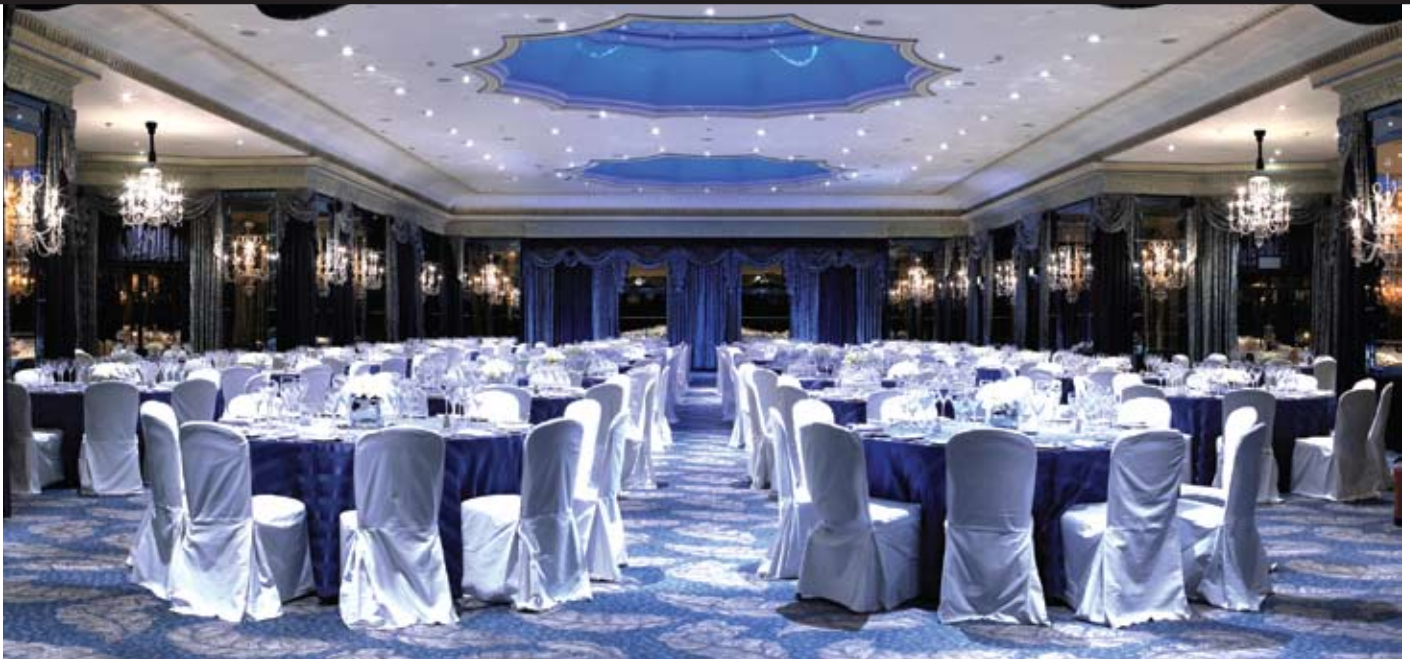
Lleoliad y cinio gala